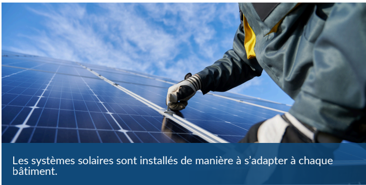
Les systèmes solaires sont installés de manière à s'adapter à chaque bâtiment.

L'énergie solaire peut améliorer la qualité de l'air et la résilience de la société en réduisant la dépendance systémique aux centrales électriques alimentées par des combustibles fossiles, qui peuvent contribuer à des problèmes respiratoires et à d'autres enjeux de santé à long terme ainsi qu'à des questions de sécurité sociétale.