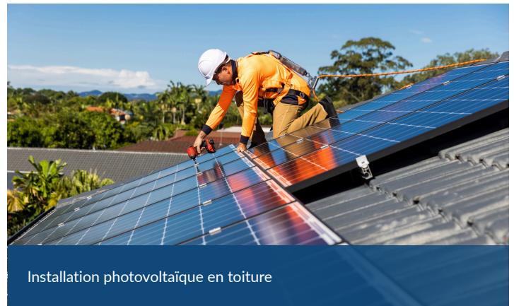
Installation photovoltaïque en toiture

Bien que la production et l'élimination en fin de vie des panneaux solaires aient un certain impact environnemental, celui-ci est bien inférieur à celui de la production d'électricité traditionnelle à base de combustibles fossiles (3, 4). Associée au stockage par batteries, l'utilisation de systèmes solaires dans les établissements de santé peut fournir une alimentation de secours fiable pour les services essentiels lors de pannes du réseau, assurant ainsi la continuité des soins. En intégrant le photovoltaïque (PV) dans les infrastructures de santé, le système de santé